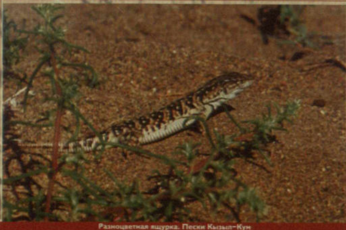
Разноцветная ящурка. Пески Кызыл-Кум

Здесь есть фрагменты соснового леса, зарослей можжевельника ложноказачского и даурского (!), ивы каспийской, осины, местами тополя серебристого и сереющего, кустов черемухи, шиповников, жузгуна, акации песчаной. Растет