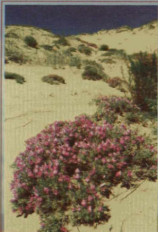
Пустыня весной. Пески Кызыл-Кум

Пустыня, как показывает жизнь, для одних — дом родной, для других — страшное место. Но именно с величайшими пустынями мира связана история многих народов, их самобытная культура, зарождение древнейших цивилизаций. Пожалуй, другие зоны земли не дали столько ученых и философов, как условия пустынь и гор. Примеры? Ближний Восток, Северная Африка, Средняя Азия. И, может быть, есть общее в форме барханов и египетских пирамид, мечетей и минаретов... У каждой пустыни свое лицо, есть оно и у каждого бархана, и, как в каждой волне, живет в них своя музыка и глубинные краски... Поэтому совсем не удивительно, что каждый шаг по пескам открывает их особенности, почерк и одну за другой странички из жизни их обитателей. Что ни бархан, гряда или дюна — уже целый космический мир. И только ленивому он не понятен. Не взволнует только лишнего воображения и жажды познания. И только в песках, где по земной мареву, где пот выедаёт глаза, и со всех стволов палит солнце, где сохнет мозг и густеет кровь, а ноги отказываются идти, познаешь исключительность пустыни.