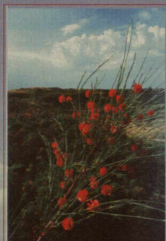
Цветет жузгун. Пески Кызыл-Кум

Каждая, даже маленькая пустыня — большая страна чудес: растения листьями рисуют здесь солнце своей пустыни, оставляют следы "летающие" как тени тушканчики и кочующие перекасти-поле. Все тут спринтеры и отличные летуны — ящерицы, птицы. И живут в